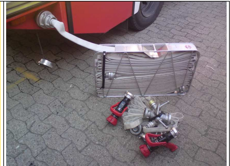
Einsatzbereites D – C – D Paket mit zwei HSR und einem STK (30m C 42)

Der Feuersaum wird von der bereits verbrannten Fläche her angegriffen. Hier ist der sicherste und rauchfreie Ort, da bereits alles verbrannt ist und das Feuer die FA nicht einschließen kann. In der Regel ist somit auch das Vorgehen mit dem Wind gesichert.